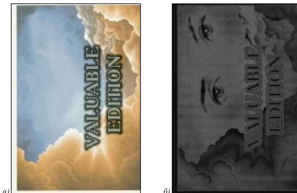
Рис. 3. Стегограмма «Облака» до (а) и после (б) применения процедуры препарирования