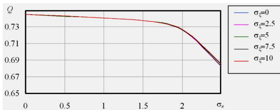
Рис. 4. График влияния искажений на качество выделения ЦВЗ